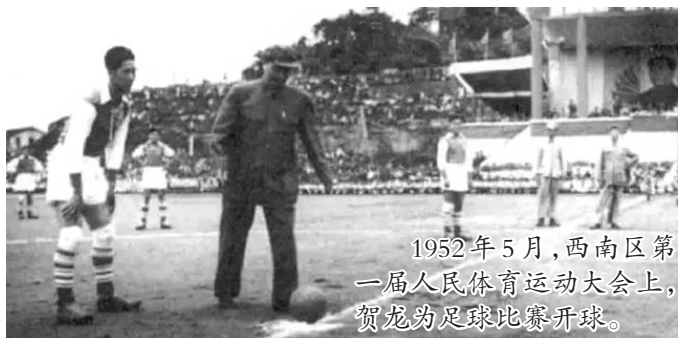
1952年5月,西南区第一届人民体育运动大会上,贺龙为足球比赛开球。

1955年7月17日,贺龙率中华人民共和国政府代表团前往波兰,参加波兰成立十周年纪念典礼。7月31日,在波兰华沙举行的第五届世界青年联欢节暨第二届国际青年友谊运动会足球赛开幕,贺龙等应邀参加了开幕式。在去波兰之前,贺龙就了解到,华沙足球队水平较高。因此,贺龙提出,中国青年足球队要随他去华沙,与华沙足球队打一场比赛。为了和华沙足