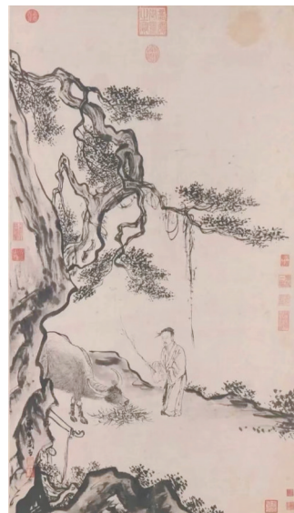
明 周臣《宁戚饭牛图》

宁戚,春秋时期棠邑人(今平度市西北唐田一带)。宁戚自幼家贫无地,靠打零工扛活为生。他从小生活在最底层,性格内向,精于钻研学问。少年时代,宁戚默默无闻,但却有着远大的抱负理想。他在长期的农业种植实践中,顺应四季天时种植粮食。他不但精通农时节气,精于农业种植,还特别精通于饲养耕牛,被誉为“懂畜语”的奇人。在远古农业时代,耕牛不但是农业种植的重要劳动力,当时的牛车也是最先进的运输工具。宁戚经常用牛车为贵