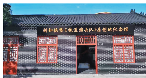
位于莒南县马棚官庄村的刘知侠暨《铁道游击队》原创地纪念馆。