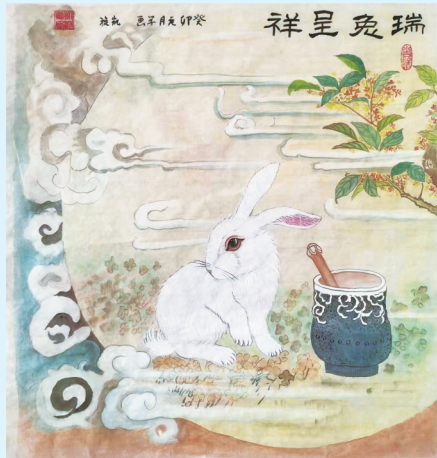
绘画 《瑞兔呈祥》 青岛市军休服务中心 南凯旋